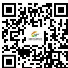
图：全国高校商业精英挑战赛赛事一体化平台二维码